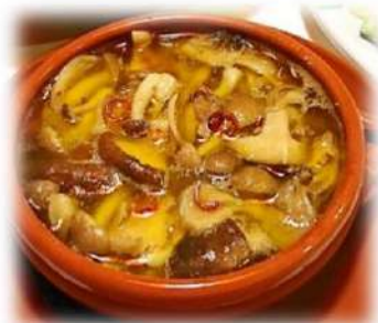
キノコのアヒージョ ¥660円