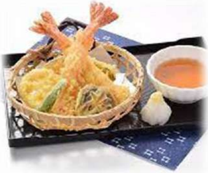
天ぷら盛り合わせ ¥900円