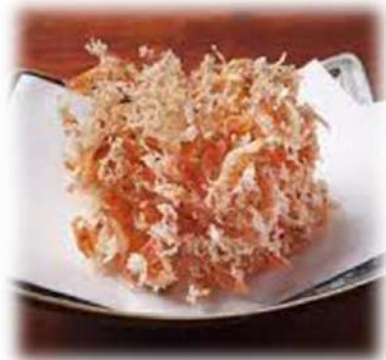
白エビと牛蒡のかき揚げ ¥580円