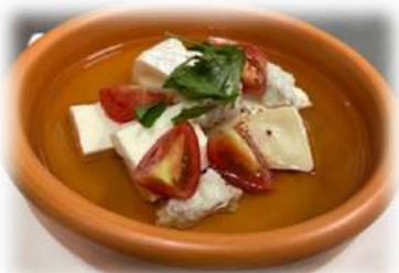
チーズのアヒージョ ¥770円